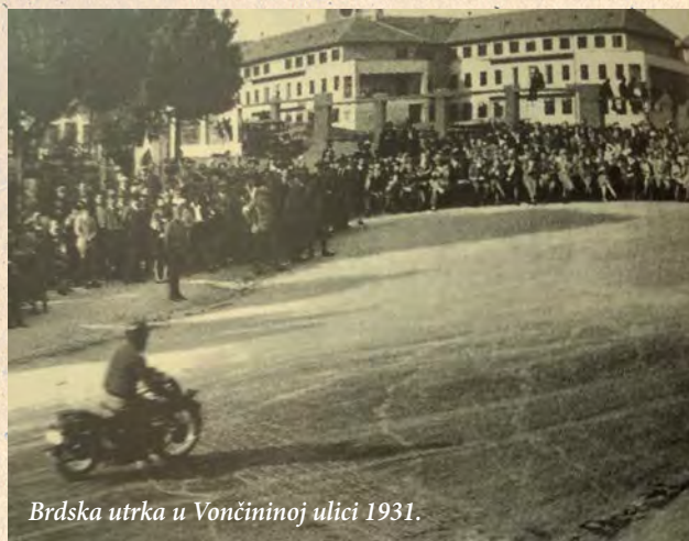
Brdska utrka u Vončininoj ulici 1931.

U Hrvatskoj je potkraj 1930-ih motošport bio najorganiziraniji savez. Održavale su se, doduše, sporadično, brdske utrke (na Plešivici samo 1926. i 1927.), a u Vončininoj ulici tijekom 1930-ih (koje su bile vrlo dobro posjećene) te na Jelenovcu i Šljivarskoj cesti. Godine 1937. 1. HMK Zagreb imao je rekordna 502 člana.